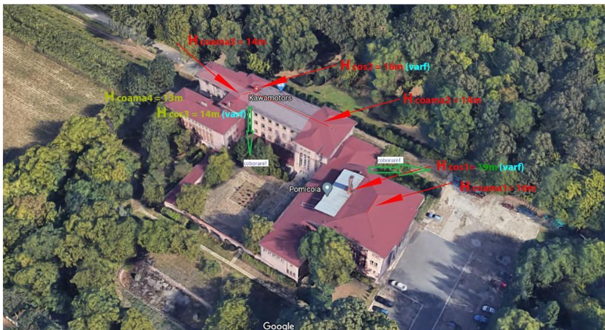
Fig. 7 – Schema reparatie instalatie de protecție la trasnet

În cadrul serviciilor de REPARATIE INSTALATIE ELECTRICA a fost reabilitata instalația de protecție împotriva trasnetului. Aceasta nu mai funcționa la capacitatea necesara, astfel incat riscul de incendiu in caz de trasnet era deosebit de ridicat. In figura 7 se prezinta schema de reparatie a instalatiei de protecție la trasnet, parte componenta a INSTALATIEI ELECTRICE a INMA.