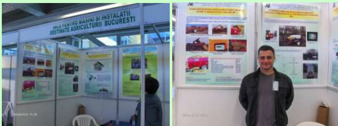
Fig. 2. Aspecte de la standul INMA București la manifestarea expozițională AGROMEXPO 2012

În perioada 26-29 aprilie 2012, INMA București a participat la târgul AGROMEXPO 2012 organizat de Camera de Comerț și Industrie Bacău la Centrul de Afaceri și Expoziții Bacău. Informațiile au fost la obiect și prezentate în detaliu de către specialiștii INMA prezenți la manifestare expozițională. În figura 2 sunt prezentate câteva aspecte de la standul INMA București, unde a fost expus posterul “ Echipament tehnic pentru aplicarea cu substanțe ecologice și precizie ridicată a tratamentelor fitosanitare -MSL ”.